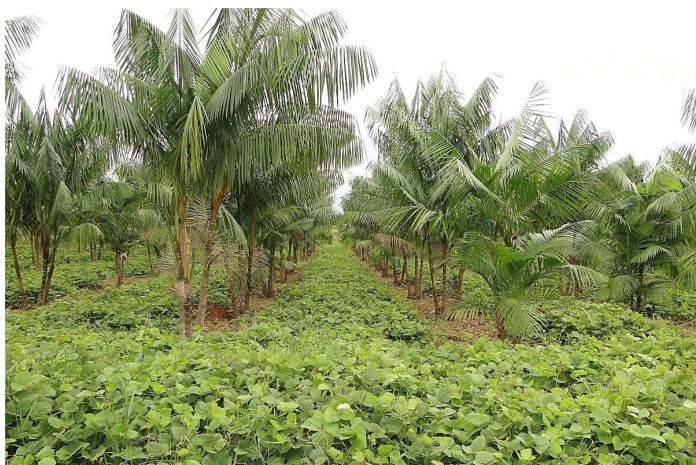
Figura 1. Área de produção de sementes de Euterpe oleracea cv. BRS-Pará, localizado no Campo Experimental da Embrapa Acre, Rio Branco, AC.